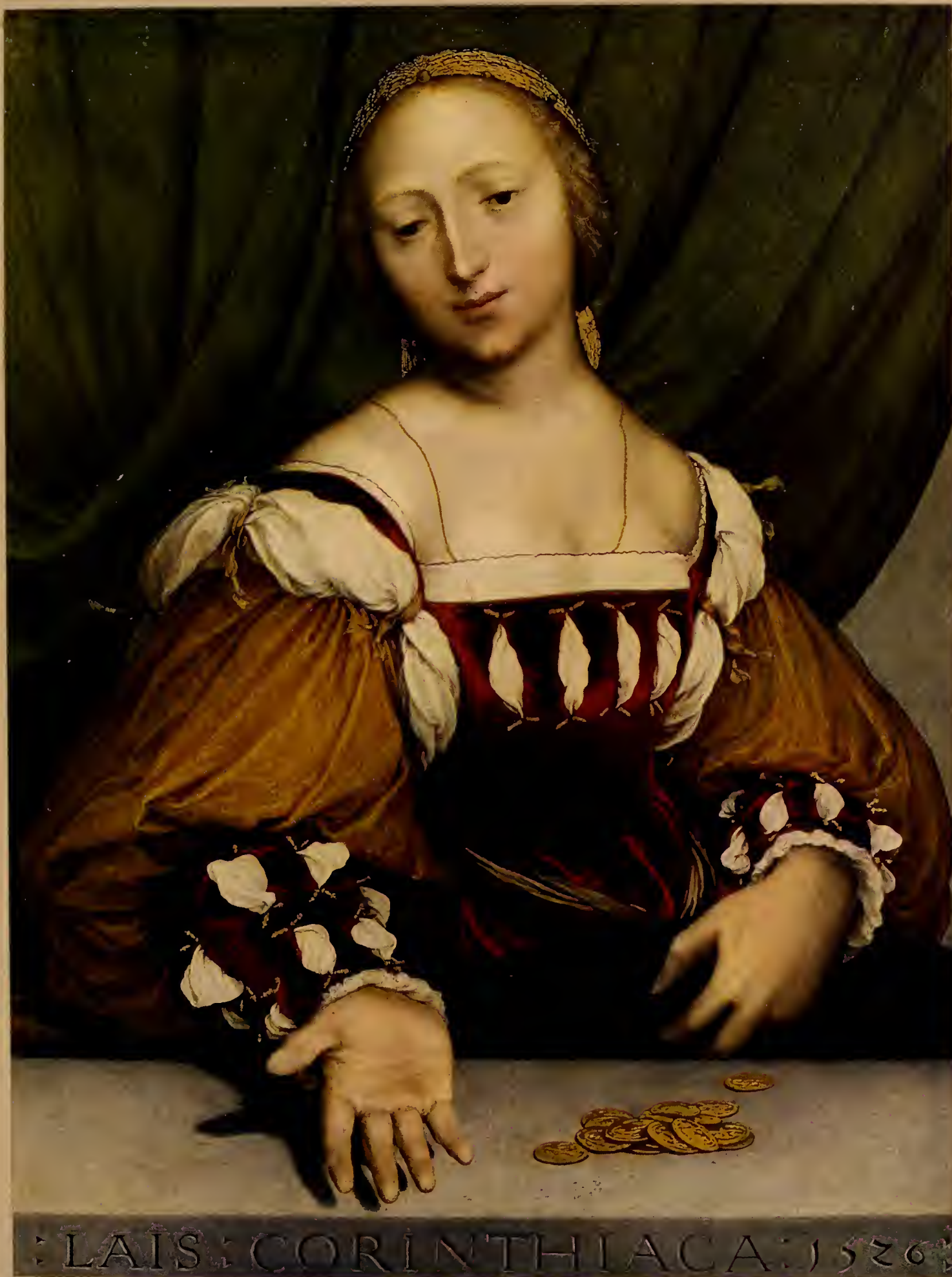
LAIS: CORINTHIACA: 1526